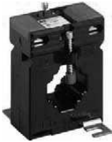
CM-CT mit angebautem Zubehör